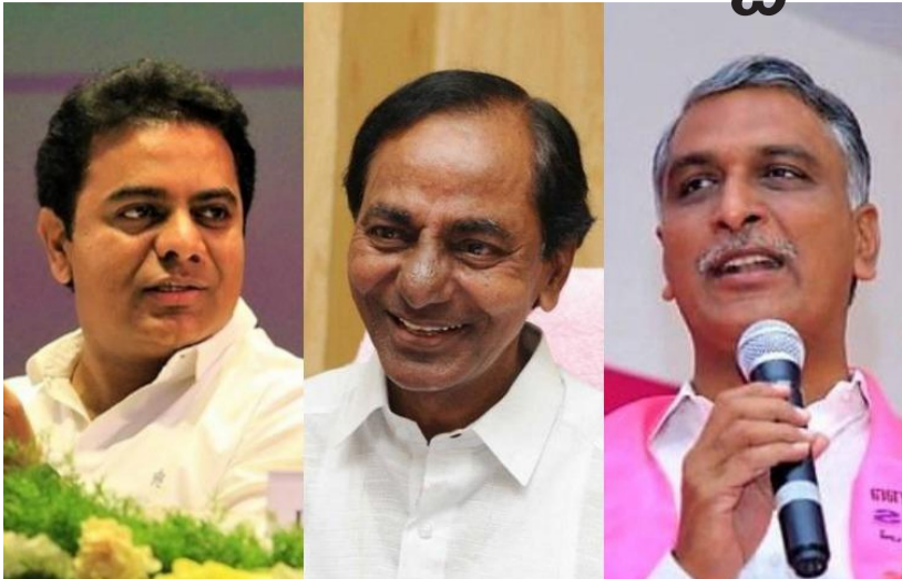
విస్తృతంగా చర్చించినట్లు పార్టీ వర్గాలు పేర్కొన్నాయి. రాజీయే స్థానిక సంస్థల ఎన్నికలు, ముఖ్యంగా జీపిఎంపీ ఎన్నికలను దృష్టిలో ఉంచుకుని పార్టీ శ్రేణులను సమాయత్తం చేయడం, సంస్థాగత నిర్మాణాన్ని మరింత పటిష్ఠం చేయడంపై ఈ సమావేశంలో ప్రత్యేకంగా దృష్టి సారించినట్లు తెలుస్తోంది.

బీఆర్ఎస్ అధినేత, మాజీ ముఖ్యమంత్రి కేసీఆర్ తో ఆ పార్టీ వర్కింగ్ ప్రెసిడెంట్ కేటీఆర్, మాజీ మంత్రి హరీష్ కౌరవ గురువారం సాయంత్రం భేటీ అయ్యారు. ఎర్రపల్లిలోని కేసీఆర్ నివాసానికి వెళ్లిన ఇద్దరు నేతలు ప్రస్తుత రాజకీయ పరిణామాలు, పార్టీ బలోపేతానికి సంబంధించిన అంశాలపై సుదీర్ఘంగా చర్చించారు. సమావేశంలో ప్రధానంగా పార్టీ సభ్యత్వ సమోదాేశం, పార్టీ శ్రేణులకు నిర్వహించుచున్న శిక్షణా తరగతులు, జీపిఎంపీ ఎన్నికల సన్నద్ధతపై చర్చ జరిగినట్లు సమాచారం. రాజీయే రోజుల్లో చేపట్టాల్సిన కార్యచరణపై కేసీఆర్ కేటీఆర్, హరీష్ కౌరవలకు పలు సూచనలు చేసినట్లు తెలిసింది. రాష్ట్రంలో ప్రజా సమస్యలపై పోరాటాన్ని మరింత ఉద్ధృతం చేయడంతో పాటు, క్షేత్రస్థాయిలో పార్టీని మరింత బలోపేతం చేసేందుకు అనుసరించాల్సిన వ్యూహాలపై కూడా సమావేశంలో