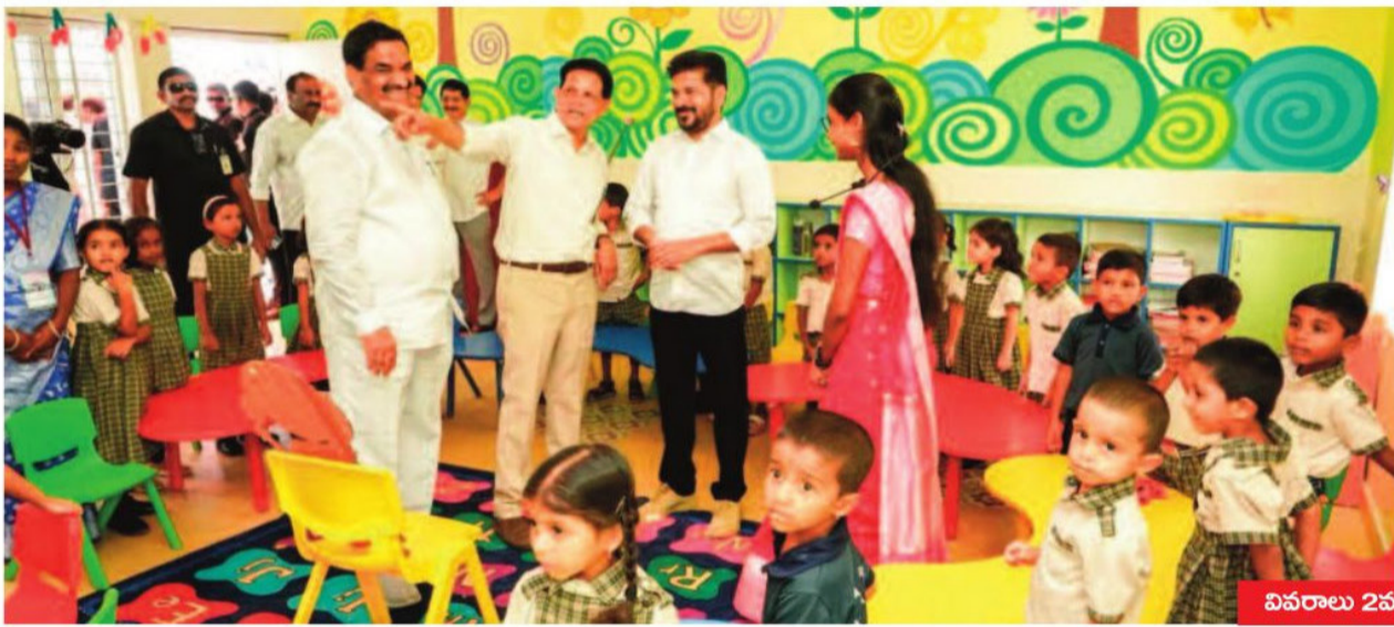
వివరాలు 2వ పేజీలో