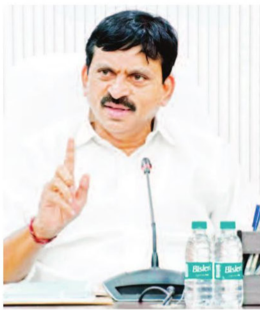
రెండో విడతలో 2.50 లక్షల ఇళ్లు..

హైదరాబాద్: రాష్ట్రంలో ఒక్క నిరుపేద కూడా గుడిసెలే ఉండకుండా, సొంతింటి కలను సాకారం చేస్తూ గుడిసెలు లేని తెలంగాణను తీర్చిదిద్దడమే ప్రభుత్వ ప్రధాన లక్ష్యమని మంత్రి పొంగులేటి శ్రీనివాసరెడ్డి స్పష్టం చేశారు. రెండో విడత ఇందిరమ్మ ఇళ్ల మంజూరులో గుడిసెల్లో నివసించే వారికి తొలి ప్రాధాన్యం ఇవ్వాలని అధికారులను ఆదేశించారు. బుధవారం హౌసింగ్ శాఖ అధికారులతో నిర్వహించిన టెలికాన్ఫరెన్స్ లో ఆయన పలు కీలక అంశాలపై దిశానిర్దేశం చేశారు. రాష్ట్రంలోని గ్రామాలు, పట్టణాల్లో ఉన్న గుడిసెలను గుర్తించేందుకు యుద్ధప్రాతిపదికన సమగ్ర సర్వే చేపట్టాలని మంత్రి ఆదేశించారు. ప్రజాపాలనలో 75,000 మంది గుడిసె వాసులు దరఖాస్తు చేసుకున్నారని, వాటిని క్షేత్రస్థాయిలో పరిశీలించి నిజమైన అర్హులను తేల్చాలన్నారు. దరఖాస్తు చేసుకోని వారు ఇప్పుడు కూడా స్థానిక ఎంపీడీవో కార్యాలయంలో దరఖాస్తు చేసుకోవచ్చని తెలిపారు.