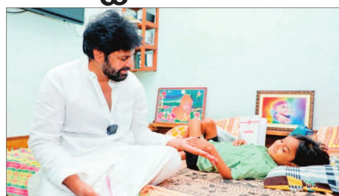
అనుమతి ఇవ్వాలని కోరారు. బాలుడి తల్లిదండ్రుల ఉపాధి కోసం వారికి ఓ క్యాంపెన్ ఏర్పాటు చేయించాలని స్థానిక జనసేన నేతలను ఆదేశించారు.