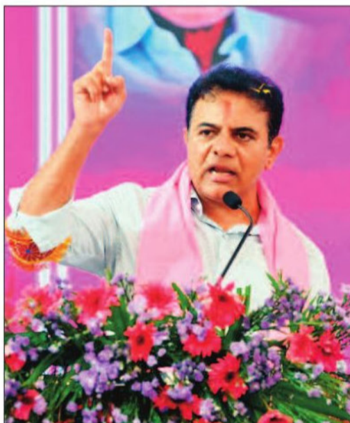
అస్తవ్యస్తం చేశారని ఆరోపించారు. కేసీఆర్ ప్రాణాలకు

ఖమ్మం: రాష్ట్రంలో ఎక్కడ చూసినా కాల్చివేతలే కనిపిస్తున్నాయని, సంక్షేమం లేదని అంతా సంక్షోభమేనని బీఆర్ఎస్ వర్కింగ్ ప్రెసిడెంట్ కేటీఆర్ విమర్శించారు. కాంగ్రెస్ నేతలు దండుపాళ్ళం బ్యాచ్ లా రాష్ట్రాన్ని దోచుకుంటున్నారని, ముఖ్యమంత్రి రేవంత్ రెడ్డికి మంత్రులు సైతం తీసిపోవడం లేదని ఆయన మండిపడ్డారు. రాష్ట్రంలో ఎన్నికలు ఎప్పుడొచ్చినా మళ్లీ బీఆర్ఎస్ దే అధికారమని, కేసీఆర్ తిరిగి సీఎం కావడం ఖాయమని ధీమా వ్యక్తం చేశారు. ఖమ్మం జిల్లా పాలేరు నియోజకవర్గంలో నిర్వహించిన బూత్ లెవల్ కార్యక్రమ శిక్షణ కార్యక్రమంలో ఆయన మాట్లాడారు. రాష్ట్రంలో రేవంత్ రెడ్డి రాక్షస పాలన సాగిస్తున్నారని, దండుపాళ్ళం మూతాకు ఆయన అడ్డంకుడైతే.. మంత్రులు ఆయన్ను మించిపోయారని కేటీఆర్ తీవ్రస్థాయిలో ధ్వజమెత్తారు. రెవెన్యూ మంత్రి అవినీతికి హద్దులు లేకుండా పోయిందని, ఖమ్మం జిల్లాకు చెందిన ముగ్గురు మంత్రులు దాచుకోవడం, దోచుకోవడం తప్ప జిల్లాకు చేసేదేమీ లేదని విమర్శించారు. ఒక మంత్రి భూ కబ్జాలకు పాల్పడుతుంటే, మరో మంత్రి వ్యవసాయ రంగాన్ని తీవ్ర సంక్షోభంలోకి నెట్టారని, ఆర్థిక మంత్రి రాష్ట్ర పరిస్థితిని