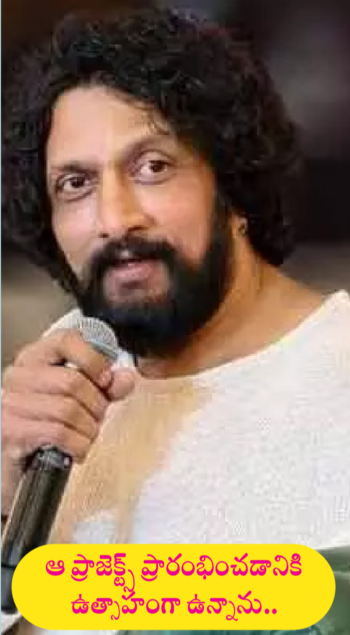
ఆ ప్రాజెక్ట్ ప్రారంభించడానికి ఉత్సాహంగా ఉన్నాను..