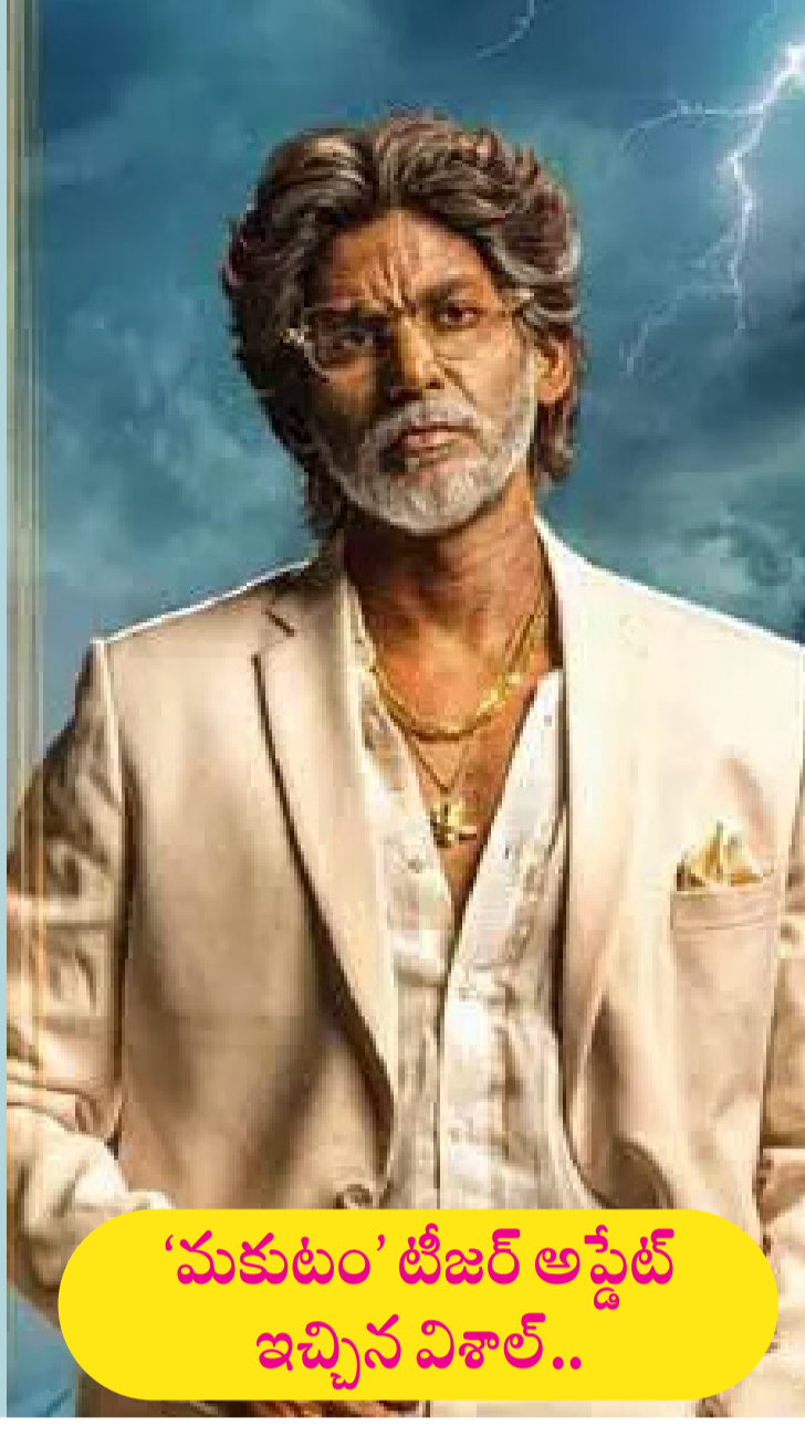
'మకుటం' టీజర్ అప్డేట్ ఇచ్చిన విశాల్..

కోలీవుడ్ హీరో విశాల్ వరుస సినిమాలతో ప్రేక్షకులను అలరిస్తూ.. ఇప్పుడు సరికొత్త అవకాశంలోకి మారారు. 'మకుటం' సినిమాలో ప్రధాన పాత్రలో నటించడంతో పాటు దర్శకత్వం బాధ్యతలు కూడా తీసుకున్నాడు. తమిళంలో 'మగుడం' పేరుతో రాబోతుంది. ఆ రిలీజ్ సూపర్ గుడ్ ఫిలిమ్స్ బ్యానర్ పై నిర్మిస్తున్నారు. విశాల్ సరసన దుషారా విజయన్, అంజలి హీరోయిన్లుగా నటిస్తుండగా.. జీవీ ప్రకాష్ కుమార్ సంగీతం అందిస్తున్నారు. 'మకుటం' చిత్రం పూర్తిగా సముద్రం బ్యాక్ డ్రాప్ లో సాగే ఒక పవర్ ఫుల్ మాఫియా, క్రైమ్ డ్రామా అని తెలుస్తోంది. ఇదిలా ఉంటే.. తాజాగా, ఈ సినిమాకు సంబంధించిన టీజర్ రాబోతున్నట్లు విశాల్ సోషల్ మీడియా ద్వారా ప్రకటించారు. "చివరికి, దర్శకుడిగా నా అధికారిక అరంగేట్రం జరుగుతోంది. ఈ కల నిజం కావాలని నేను గత 30 ఏళ్లకు పైగా ఎంతో ఆశతో, ఆరాటంతో ఎదురుచూశాను. మకుటంలో కల నిజం కాబోతోంది. మేము ఎంతో శ్రద్ధగా, ఇష్టపడి రూపొందించిన ఈ చిత్రాన్ని మీ ముందుకు తీసుకురాబోతున్నందుకు చాలా ఉత్సాహంగా ఉంది. జూన్ 10న 'మకుటం' టీజర్ ను మీ ముందుకు తీసుకువస్తున్నాం. మాపై దేవుని ఆశీస్సులు ఎప్పుడూ ఉండాలి" అని ఎమోషనల్ అయ్యారు.