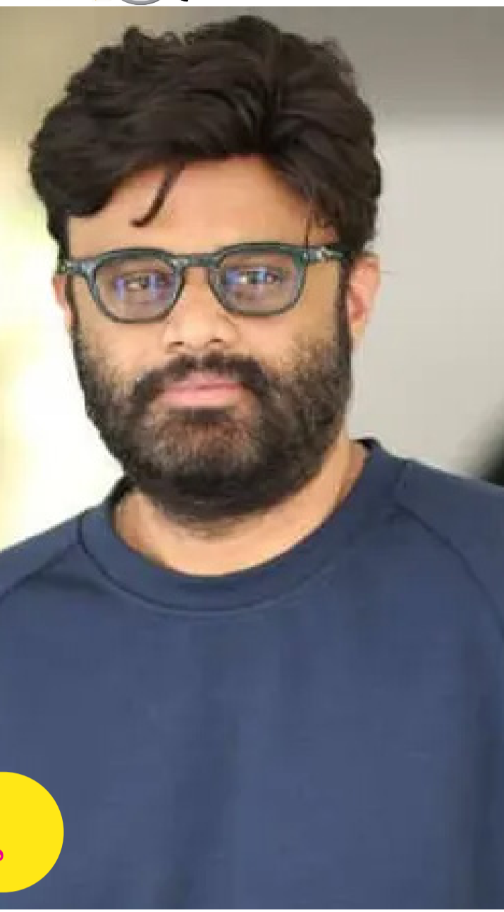
నాగవంశీకి అనుకోని అదృష్టం.. గట్టి జాక్ పాట్ తగిలిందిగా

ఈ విజయంతో సూర్య తదుపరి సినిమాలపై అంచనాలు పెరిగాయి. ప్రస్తుతం సూర్య, నాగ వంశీ నిర్మాణంలో రూపొందుతున్న 'విశ్వనాథ్ అండ్ సన్స్' చిత్రంలో నటిస్తున్నారు. ఈ సినిమాకు వెంకీ అట్లూరి దర్శకత్వం వహిస్తున్నారు. 'కరుప్పు' భారీ విజయం సాధించడంతో 'విశ్వనాథ్ అండ్ సన్స్' పై కూడా భారీ అంచనాలు ఏర్పడ్డాయి. దీంతో ఈ సినిమా అన్ని రకాల హక్కులకు ముందుగా ఊహించిన దానికంటే ఎక్కువ ఆఫర్లు వస్తున్నట్లు సమాచారం. దీంతో నాగ వంశీకి అనుకోని అదృష్టం కలిసి వచ్చిందని ఇండస్ట్రీ పర్సనలు అభిప్రాయపడుతున్నారు.